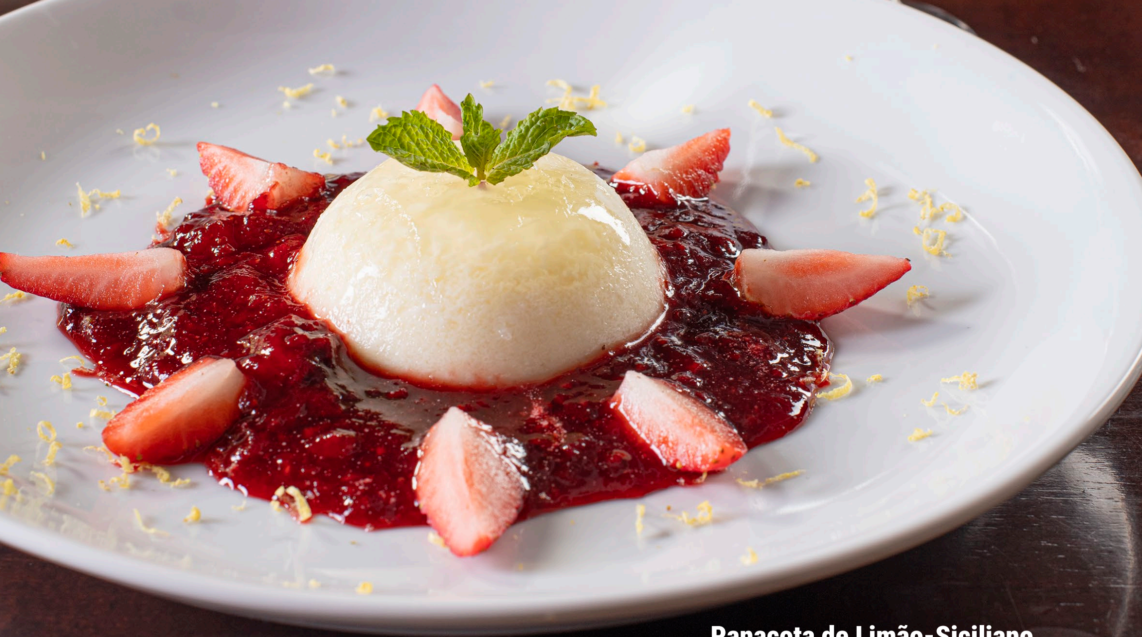
Panacota de Limão-Siciliano com Frutas Vermelhas